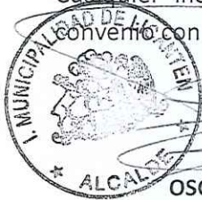
OSCAR FERNÁNDEZ VILOS ALCALDE ILUSTRE MUNICIPALIDAD DE LICANTÉN

Cualquier incumplimiento a esta cláusula será considerado un incumplimiento al convenio con el PMI en sí mismo, con las sanciones que sus bases ameriten.